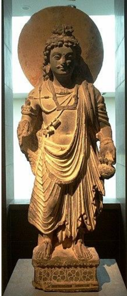
Maitreya Buddha dari abad ke-2 masehi Periode Kesenian Gandharan